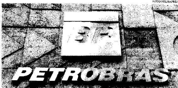
Solicitação precisava ter a anuência da maioria do conselho para se tornar inquérito administrativo e teve apoio unânime

A solicitação precisava ter a anuência da maioria do conselho para se tornar um inquérito administrativo e teve apoio unânime dos seis membros do tribunal administrativo do Cade. Assim, o pedido abre duas frentes de investigações tendo como centro a refinaria vendida para o fundo Mubadala, dos Emirados Árabes. Em uma, a estrutura seria vítima, uma vez que paga mais caro pelo petróleo do que as unidades ainda sob controle da Petrobras, enquanto na outra, será investigada por cobrar mais caro do combustível vendido na Bahia, estado onde é localizada e tem o monopólio do