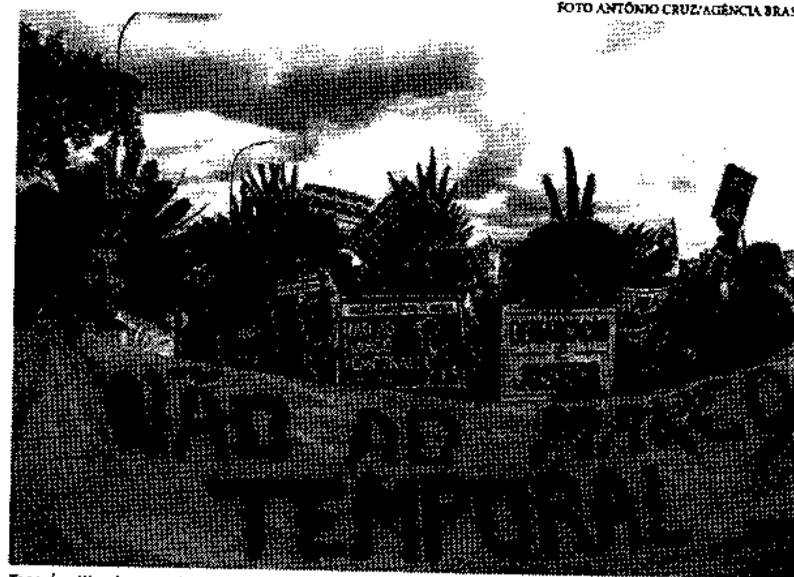
Tese é criticada por advogados especializados em direitos dos povos indígenas

Pela ordem de votação do Supremo, o ministro que deveria iniciar a sessão hoje seria Luiz Fux, mas Toffoli pediu para antecipar o voto. "Estamos a julgar a pacificação de uma situação histórica. Não estamos a julgar situações concretas, estamos