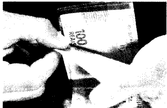
Los R$ 14,5 bilhões em isenção distribuídos, R$ 22 bilhões foram direcionados para renovação dos incentivos fiscais.

O Congresso Nacional deve aprovar nos próximos dias a prorrogação até 2028 de incentivos fiscais concedidos a empresas que atuam nas áreas da Sudam, referente à Região Norte, e Sudeco, referente ao Nordeste, além de ampliar a Sudacem, do Centro-Oeste. As demarcações de impostos a projetos das regiões Norte e Nordeste para 2023 foram estimadas em R$ 14,5 bilhões. Isso porque, segundo o vigente programa de incentivos e renovação, a prorrogação de 2023 de dezembro.