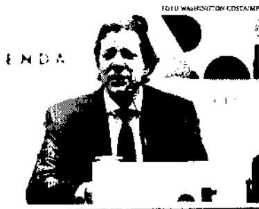
Pacote fará parte de uma medida provisória que deve ser editada pelo governo ainda em 2023